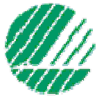
Mynd 4. Svanurinn, Norræna umhverfismerkið 41